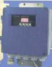
ZRY (Version IP 65)